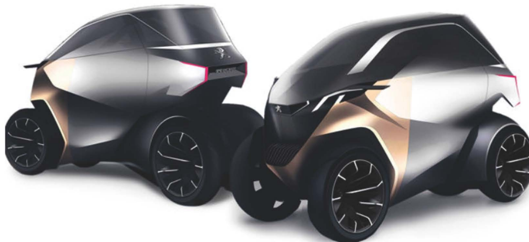
Eines der EU-LIVE Konzepte von Peugeot