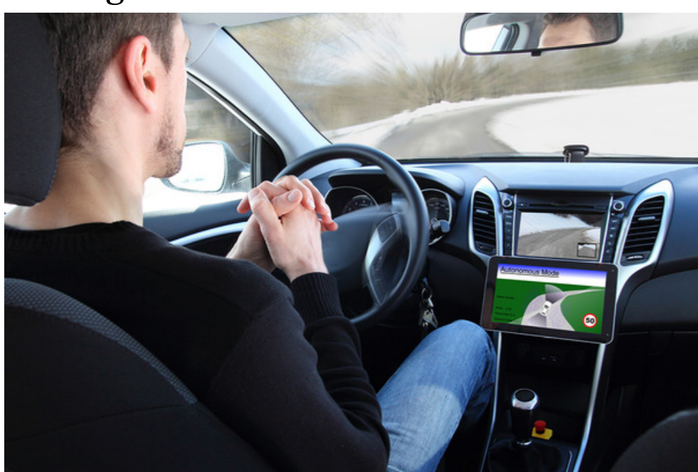
Autos fahren selbst: Die Steiermark will Testregion für selbstfahrende Autos werden.